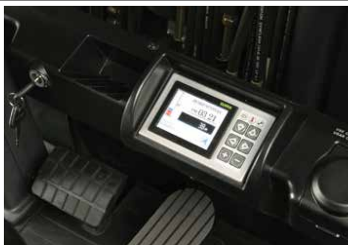
TABLEAU DE BORD INTERACTIF LCD COMPLÈTEMENT PROGRAMMABLE